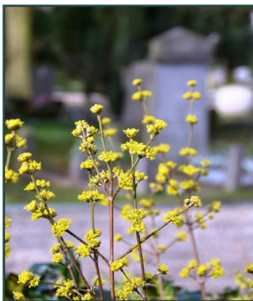
Boomsortbeschrijving arboretum De Nieuwe Ooster