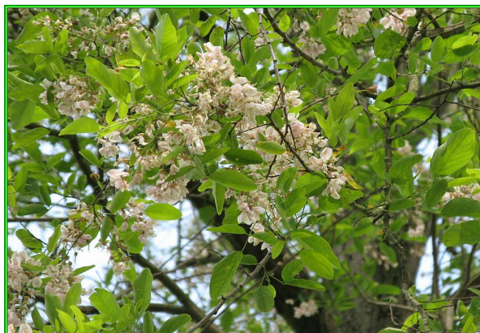
Boomsortbeschrijving arboretum De Nieuwe Ooster