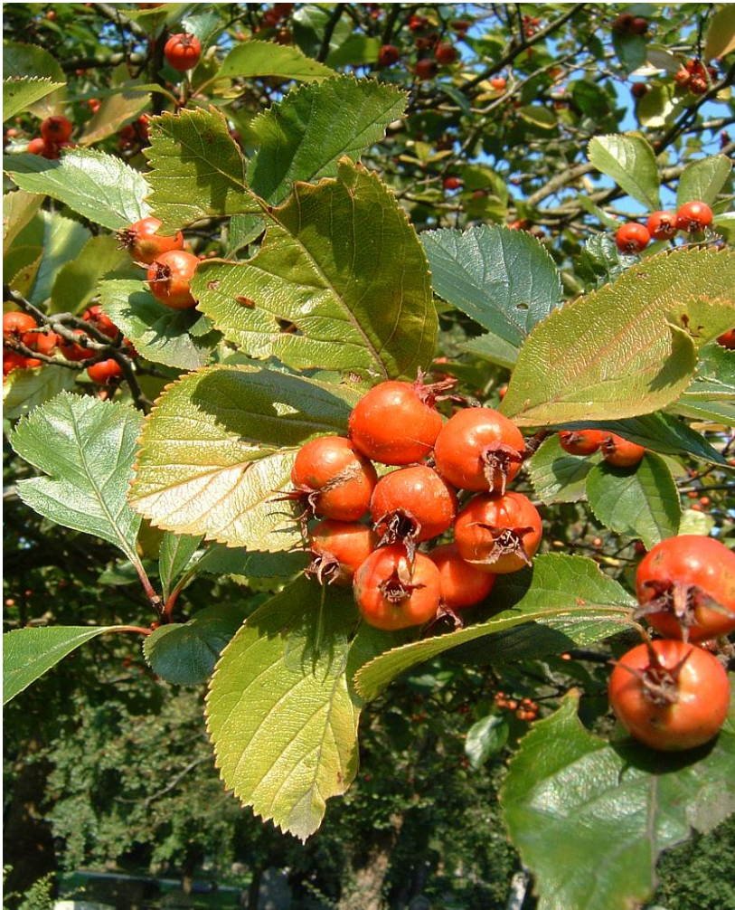
Boomsortbeschrijving arboretum De Nieuwe Ooster