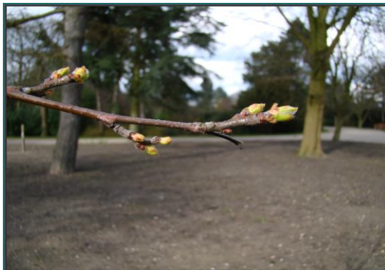
Boomsortbeschrijving arboretum De Nieuwe Ooster