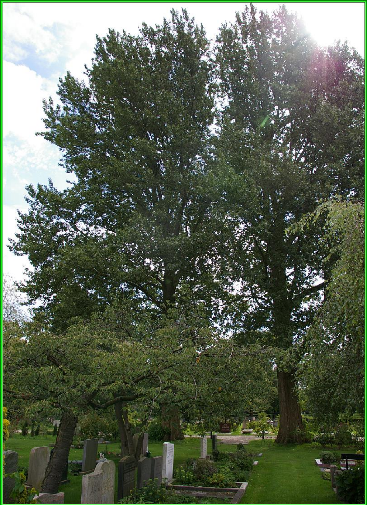
Boomsortbeschrijving arboretum De Nieuwe Ooster